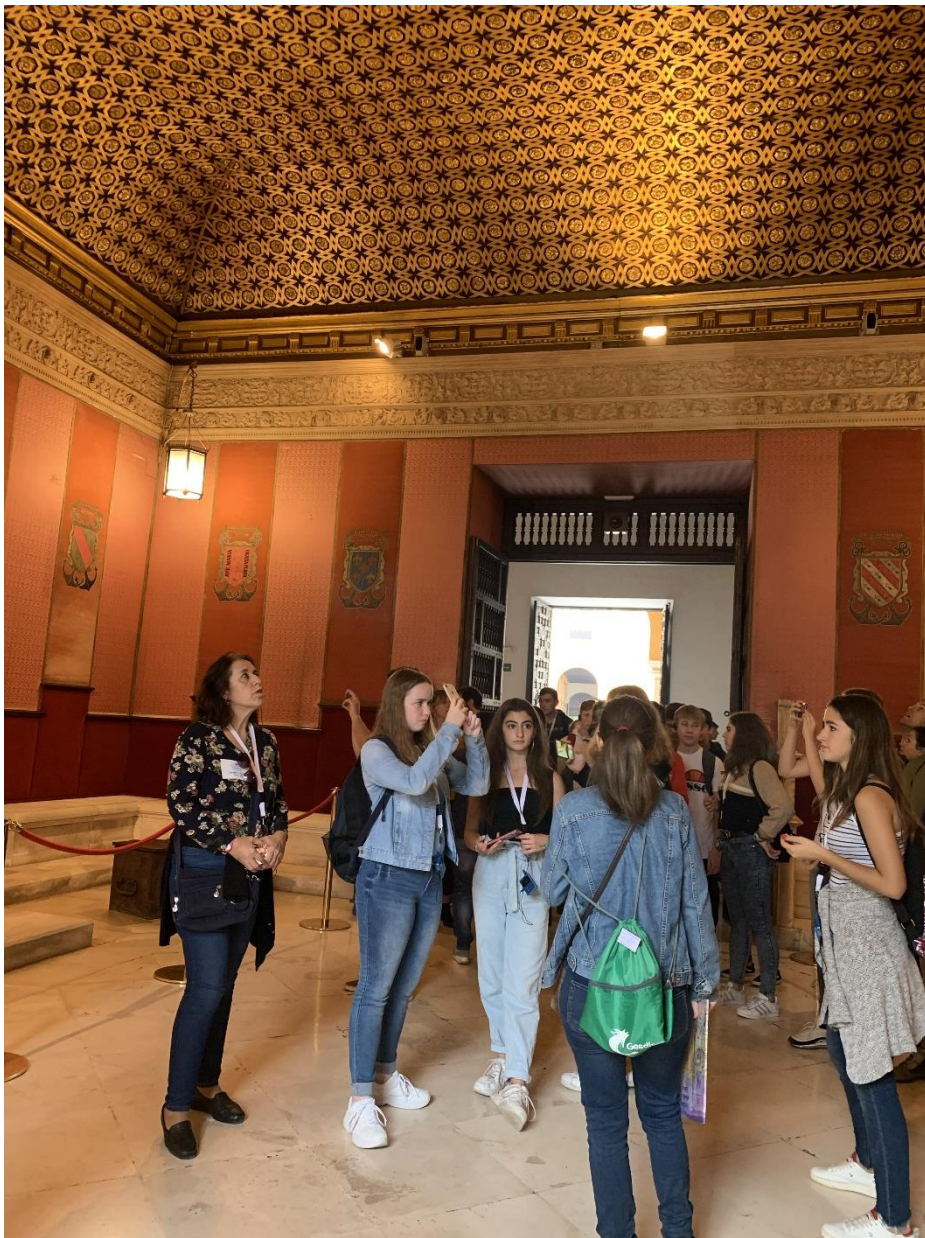
Besuch der Stierkampfarena „Plaza de toros de la Real Maestranza de Caballería de Sevilla“